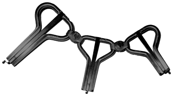
Kit professionnel D-G-C avec connecteur à vis monté en permanence

Les Guimbarde font de préférence parties des "triades de musique folklorique" Compilé. par exemple.