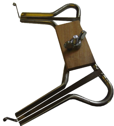
Set iniziale D-G con connessione a vite staccabile

Al fine di cambiare la chiave all'interno di una canzone, anche L' arpa dell ebreo deve essere cambiata. Per questo sono collegati tra loro.